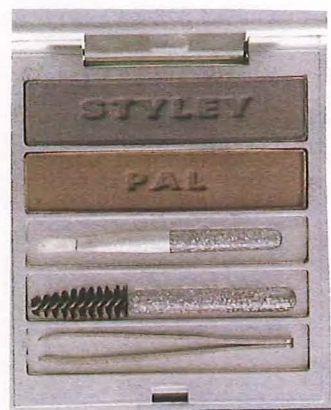
アイブロウ&アイライナー