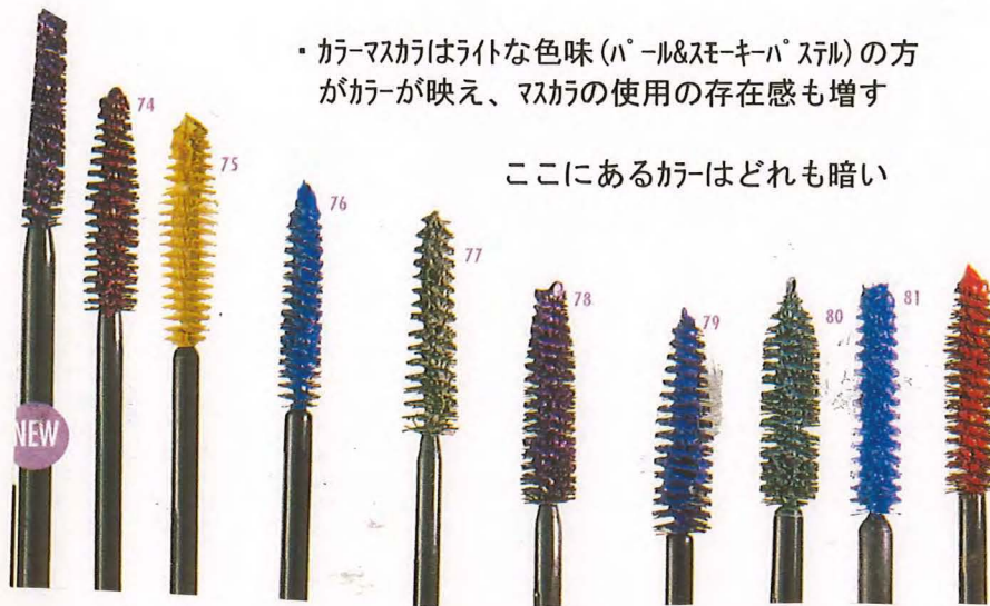
カラーマスカラ&ラメマスカラのコンビ