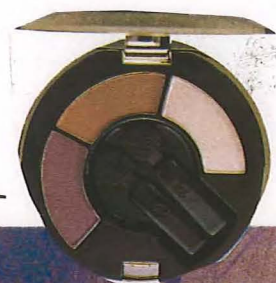
クリームアイライナー3色セット

ペンシルやキットでは2色組み合わせが限界だが パレットなら3色以上の組み合わせも可能