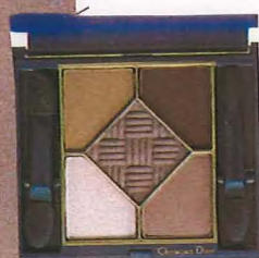
アイライナー&アイカラー アイシャドウ3色 アイライナー2色の組み合わせ