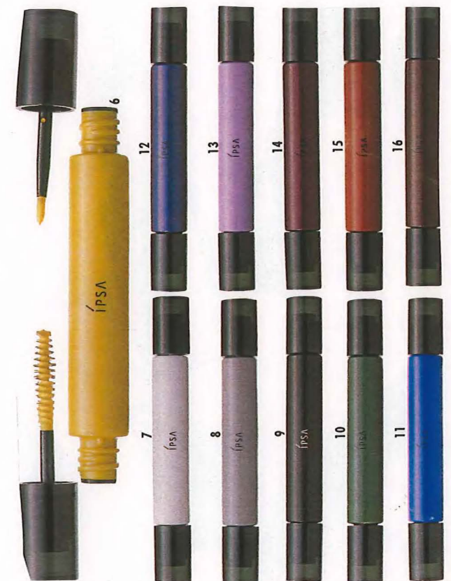
カラーアイラッシュ カラフルなつけまつ毛