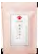
▲焼きあごと焼き煮干の合わせだし